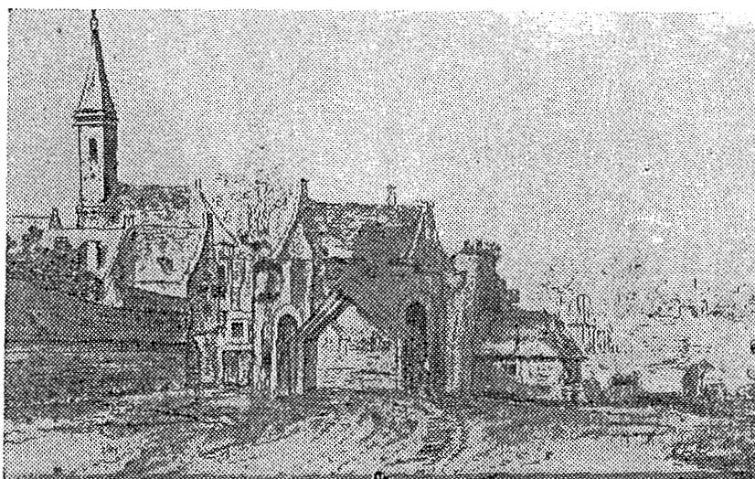
Poort van het kerkhof, en de kerk te Zeist, omstreeks 1670.