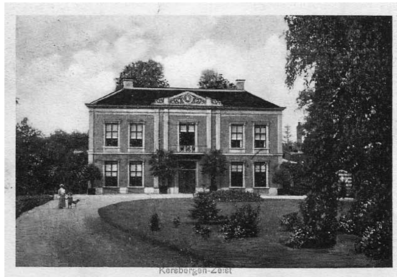
Buitenplaats Kersbergen. Rechts tussen de bomen het bekende poortje (prentbriefkaart).