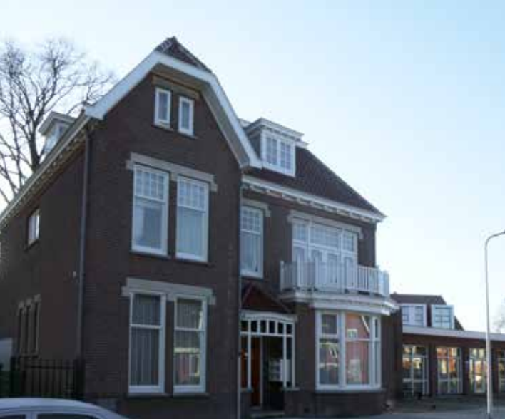
De voormalige locatie van de drukkerij aan de Noordweg 93 a , Zeist (2012).