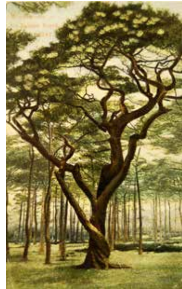
De laan van Beek en Royen (ca. 1905).

den. Zeist dankt haar bekendheid niet alleen aan het Slot, maar zeker ook aan de lanen, de bossen en parken. Het jaar 2013 was bij uitstek een gelegenheid om dit alles voor het voetlicht te brengen. Het was immers precies honderd jaar geleden, dat de gemeente Zeist besloot het Zeister Bos aan te kopen. Een bos van wel 200 hectare