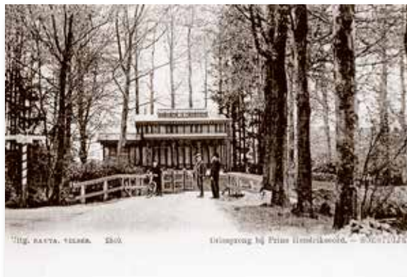
Driesprong Embranchementsweg-Biltseweg bij Prins Hendriksoord (jaartal onbekend).

betalen, wat vroeger niet 't geval was, en een steenen trap (100 treden!) vergemakkelijkt de beklimming, die vroeger langs zig-zag paadjes geschiedde. Halverwege heeft men al een klein platform gemaakt, maar het uitzicht is daar nog niet veel bijzonders. Maar toen we waren bovengekomen, ontrolde zich een grootsch panorama voor onze oogen. We troffen het met de belichting, zooals ik boven reeds heb verteld. In het Zuiden en Zuid-Oosten is het landschap zelf niet bepaald afwisselend, maar daar dit de zonzijde was, werd veel door de lichtspelingen vergoed. Vooral aan de kant van Utrecht en Amersfoort is veel afwisseling. De forschdom van Utrecht, en de kerk van Amersfoort steekt ver boven alles uit. Zelfs de toren van Nijkerk is duidelijk zichtbaar. Aan de Noordkant ziet men het vliegtterrein van Soesterberg, waar toen door de artillerie geschoten werd, zooals een militair ons meedeelde, die tevens de welwillendheid bezat ons even zijn kijker te leenen. De Hilversum-