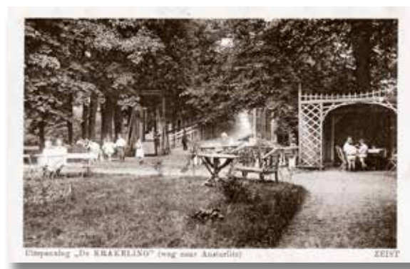
Uitspanning „De KRAKELING” (weg naar Anstcrilte)