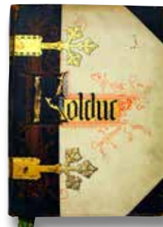
Omslag van 'Rolduc in woord en beeld'.

ERFGOEDCENTRUM NEDERLANDS KLOOSTERLEVEN, ARCHIEF VAN DE FRATERS VAN UTRECHT, DOOS 410