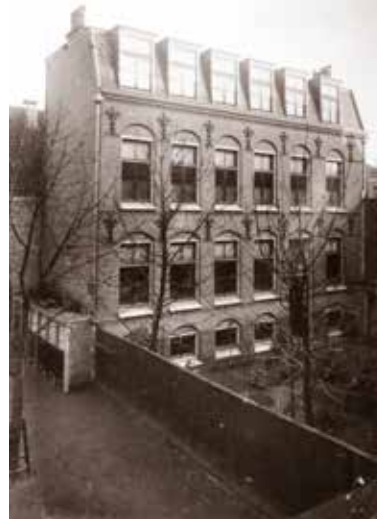
De vierde locatie van de drukkerij, de nieuwbouw in de tuin van het St.-Gregoriushuis (1898).

De schuur waarin de drukkerij begon heeft maar enkele maanden als