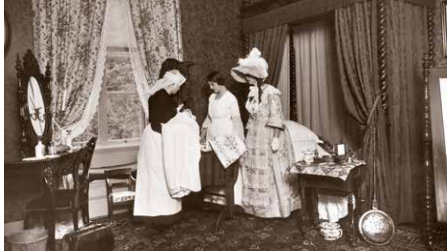
Slaapkamer, inrichting omstreeks 1850.