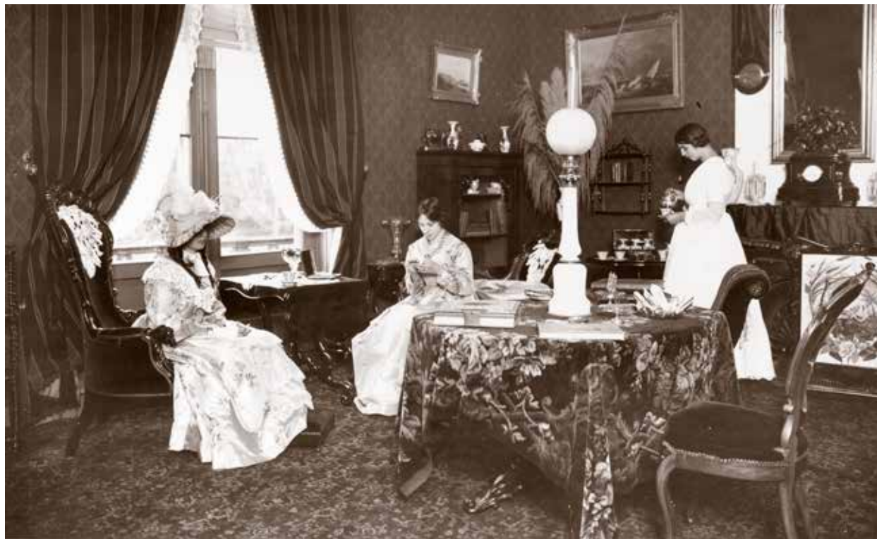
Zitkamer, inrichting omstreeks 1850.