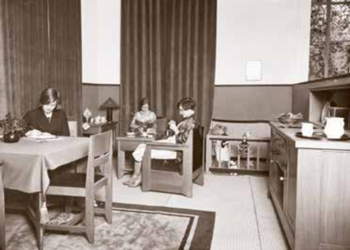
Zitkamer, ingericht door de firma Pander en Zonen, 1927.