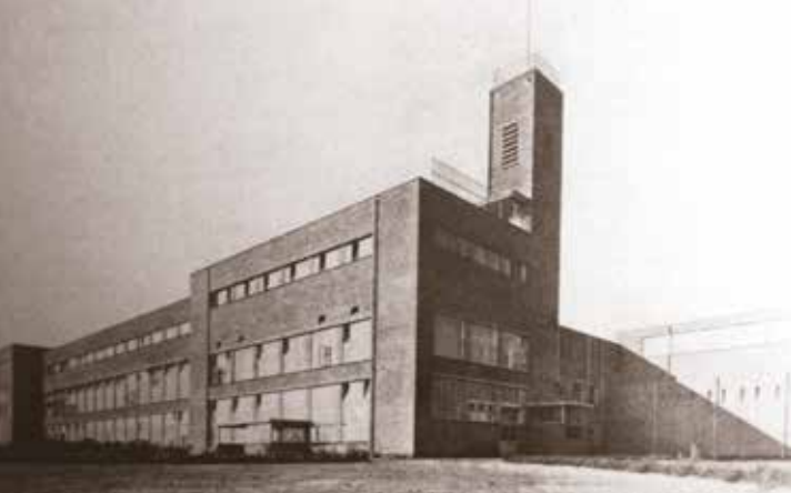
St.-Jozef Kweek-school (1932).