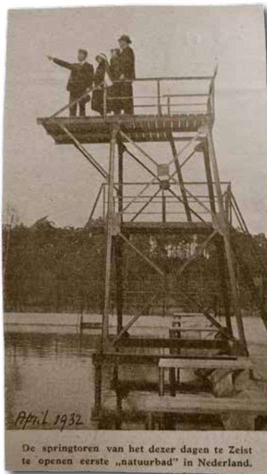
De springtoren bij de opening (1932).