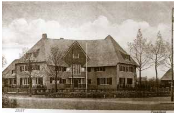
Villa Pasadena (ca. 1925).

In 1952 is de villa verkocht aan de Stichting De Opbouw, een instelling voor de verpleging van chronisch zieken. Op 24 april 1953 sloeg het noodlot echter toe. Het Utrechtsch Nieuwsblad meldde op 25 april: 'Rusthuis Pasadena in ruïne herschapen'. Gisteren werd, zoals wij reeds in een deel van onze editie meldden, Zeist opgeschrikt door een zeer felle brand, die het rusthuis voor chronische zieken "Pasadena", van de stichting "De Opbouw", tot weinig meer dan een ruïne maakte. Zestig invalide en hulpbehoevende patiënten waren hierin aanwezig; zij konden allen bijtijds gered worden, evenals een groot deel van huisraad en bezittingen. De twee verdiepingen van het monumentale huis, dat op de hoek van Lindenlaan en Verlengde Slotlaan staat, kunnen als verloren worden beschouwd; zo ook een gedeelte van de parterre dat door vuur en water ernstig te lijden had. (...). Uren achtereen is