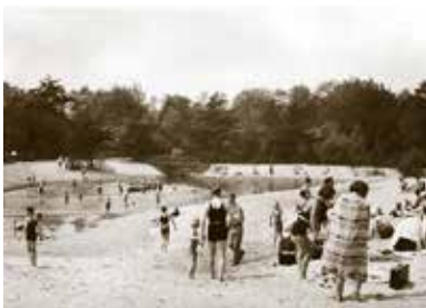
Kinderbad met strand (ca. 1950).