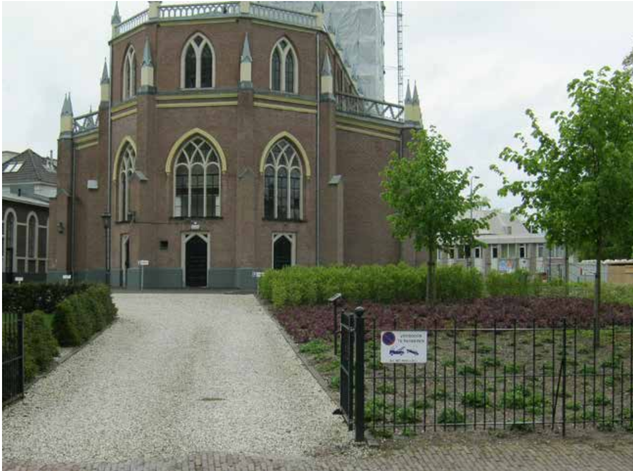
De achterzijde van de Oude Kerk met de kerkheuvel (2014).