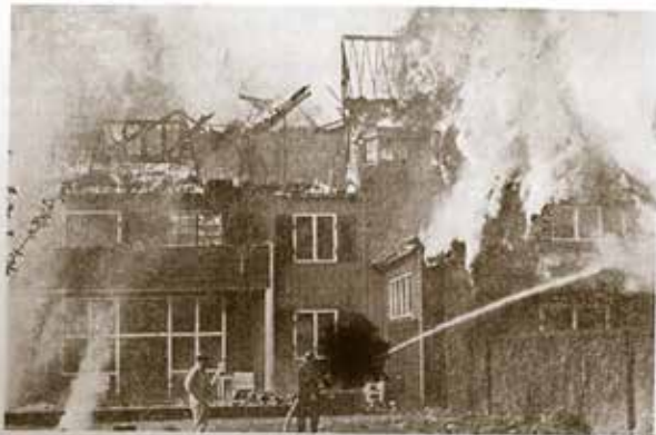
Huize „Pasadena“ te Zeist door brand vernield (Vereeniging doet de schade??)

Verzekering dekt de schade, ja, maar dat betekent alleen, dat de schade aan inventaris en aan eigendommen van personeel en patiënten vergoed zal worden.