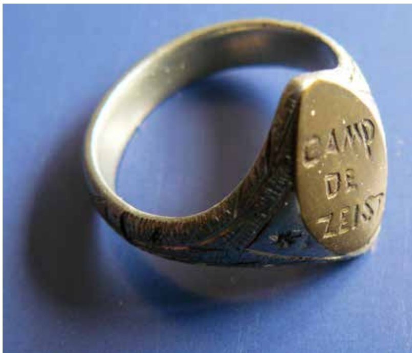
Ring 'CAMP DE ZEIST'.