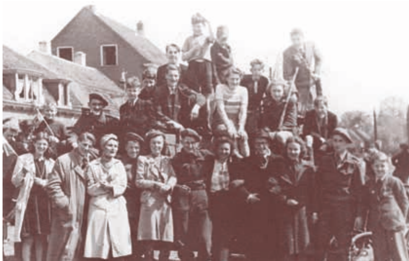
Bijschrift achter op de foto: '7 Mei 1945 / „Bevrijdingsdag” / Tommies in Zeist'.