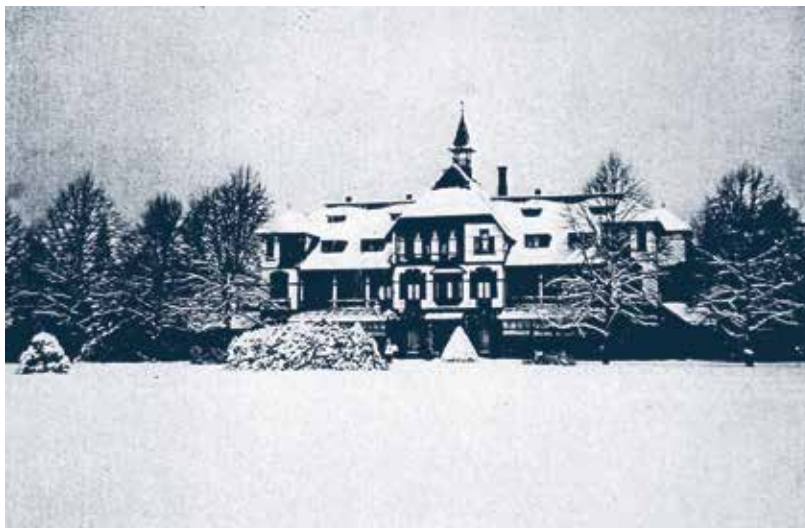
Hoofdgebouw Chr. Sanatorium in Zwitserse chaletstijl (ca. 1940).

Op het terrein van Emelaar stond een zogenaamde romneyhut (ook