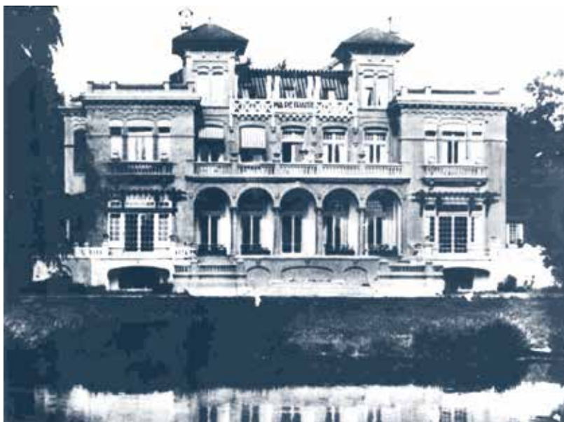
Villa 'Ma Retraite', tijdens de mobilisatie donker geschilderd.