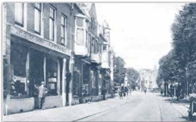
Afb.1 Het pand 2° Dorpsstraat 34.