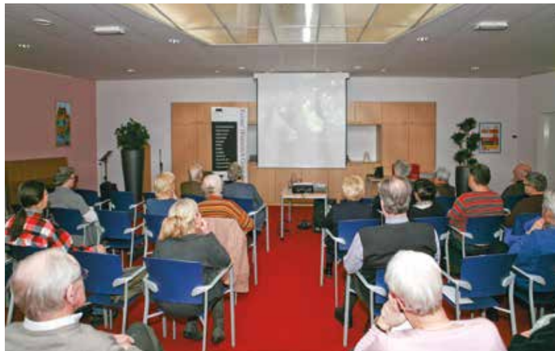
Filmvoorstelling in het Lichtpunt (17-3-2015).