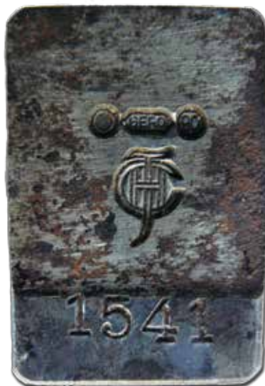
Afb. 1b Matrijs van afb. 1a.