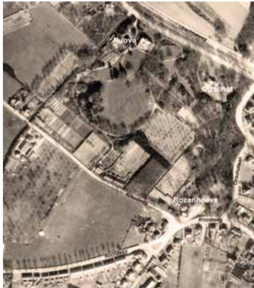
Luchtfoto 1937. TOPOGRAFISCHE ONDERGROND ©KADASTER ZWOLLE