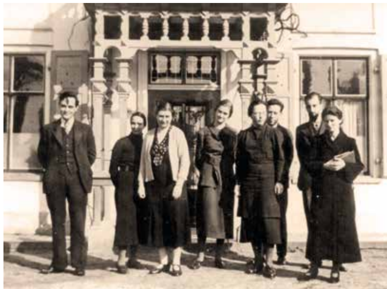
Het eerste lerarenteam van de Zeister Vrije School poserend voor de Rozenhoeve (ca. 1935).

In die jaren ontwikkelde de gemeente ook plannen voor een weg die de Koppelweg met de Utrechtseweg zou verbinden. De geplande weg liep vlak langs de Rozenhoeve, die dan zou moeten worden afgebroken. De plannen voor de wegaanleg gingen uiteindelijk niet door, maar be-