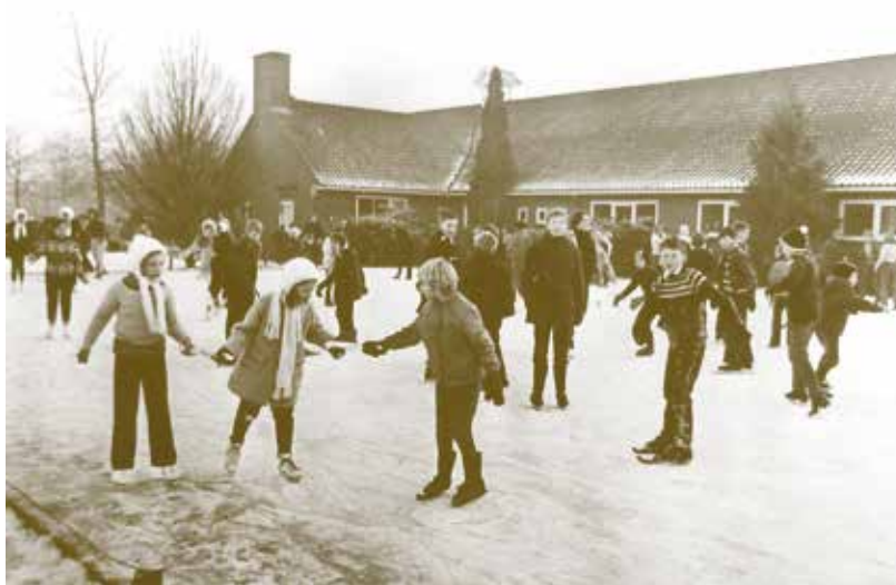
Ijspret op het schoolplein van de Montessorischool voor openbaar basis onderwijs, Sumatralaan 1 (1969).