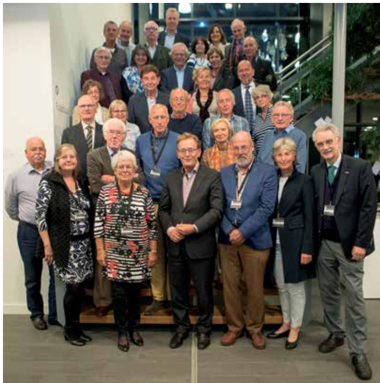
Bestuur, medewerkers, oud-medewerkers van het ZHG en burgemeester Koos Janssen op de reünie op 13 september 2017 in de publiekshal van het gemeentehuis.