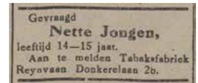
Advertentie uit De Zeister Courant van 7 juni 1924.