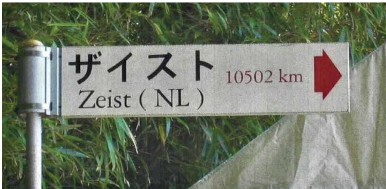
Het bord op Holland Eiland met de richting en afstand naar Zeist. Geplaatst in 2000 en vernieuwd na de tsunami in 2016.

Op 13 mei 2000, in het jaar van de viering van '400 jaar betrekkingen Nederland-Japan', werd in Yamada het vriendschapsverdrag ondertekend, waarin staat dat beide gemeenten 'ernaar zullen streven uitwisselingen op cultureel gebied tot stand te brengen', 'mogelijkheden te zullen onderzoeken voor uitwisseling en samenwerking op andere gebieden' en 'de vriendschap tussen