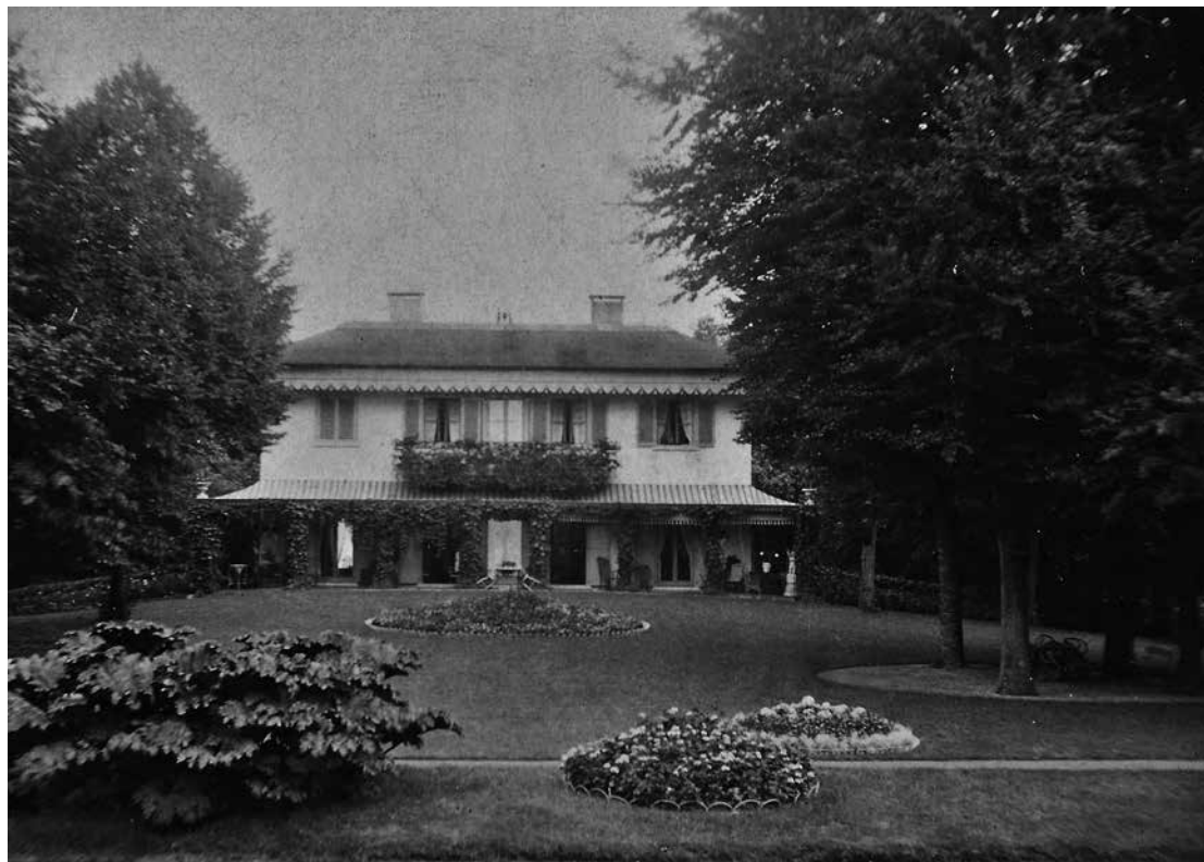
Beerschoten in Driebergen.