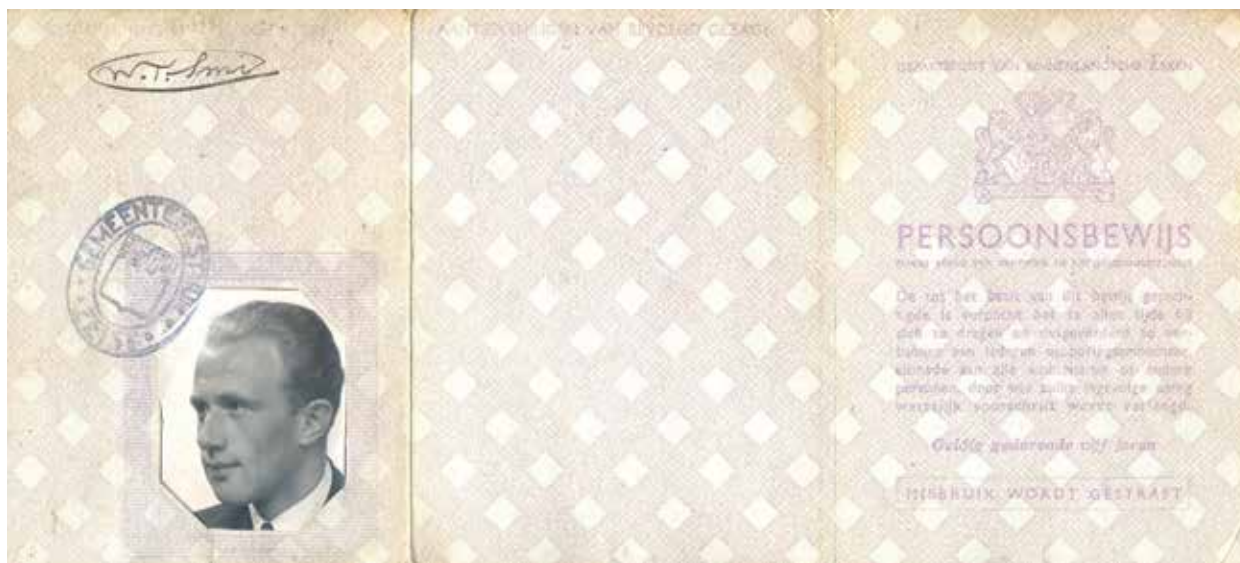
Afb.1 Persoonsbewijs W.F. Smit, buitenzijde.