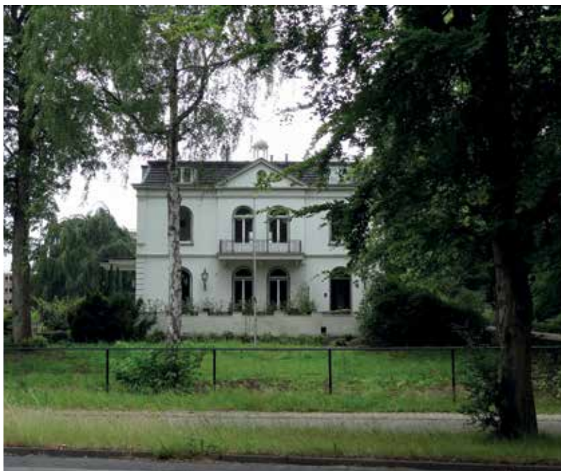
Nieuw Beerschoten in Zeist.

Bij een rieten dak is het gebruik van zink heel onverstandig omdat dat snel aangetast wordt door het riet. Daarom wordt dan koper gebruikt,