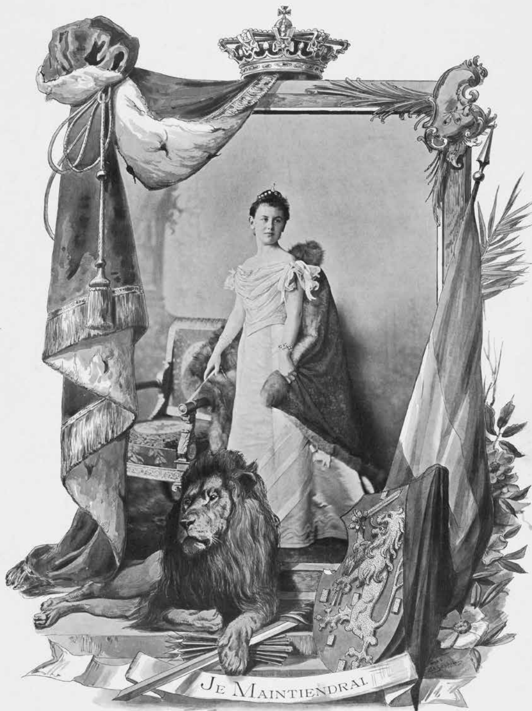
H. M. KONINGIN WILHELMINA.