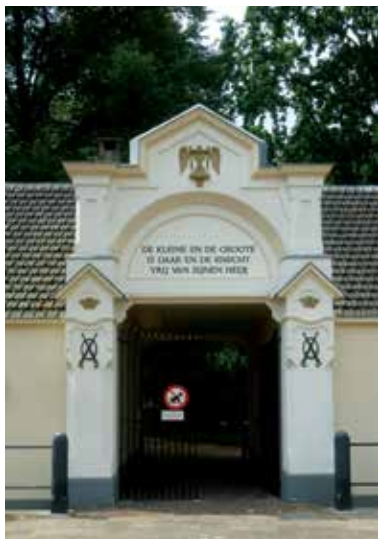
Oude Algemene Begraafplaats, Bergweg 21-23

Het begrip 'neoclassicisme'* kwam pas halverwege de 19 e eeuw in zwang. Tot die tijd heette het 'de ware stijl', wat wel aangeeft hoe men tegen deze kunst aankeek. Kenmerken van het neoclassicisme, graag voor monumentale architectuur gebruikt, zijn: toepassing van een fronton, vrijstaande zuilen of pilasters, kapitelen en kroonlijsten, sterk benadrukte ingangspartijen in het midden van een symmetrische voorgevel.