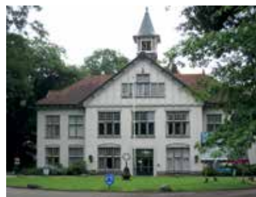
Het poortgebouw van de Oude Algemene Begraafplaats in Zeist werd in 1884 voorzien van een fronton met pilasters en kroonlijst in de stijl van het neoclassicisme.

Door een toename van handel en industrie was de periode tussen 1880 en 1940 voor Nederland een tijd met veel welvaart, een soort tweede Gouden Eeuw. Kantoren, fabrieken en stations werden gebouwd. Het wegen-, waterwegen- en spoorweg-net werd uitgebreid. Door de nieuwe