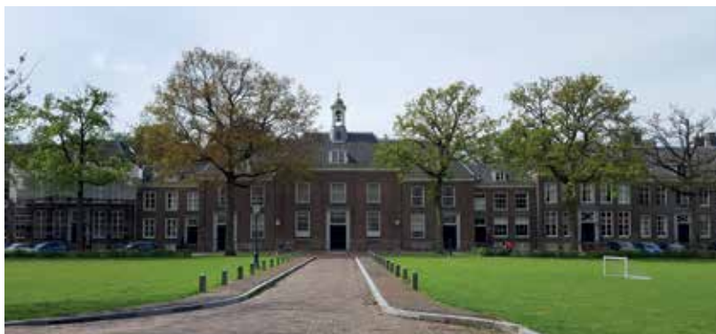
De gevelwanden van het Broederplein en het Zusterplein zijn gebouwd in de sobere classicistische Lodewijk XIV-stijl van de 18 e eeuw.