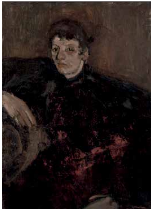
Portret van Marie Jordan door haar echtgenoot G.H. Breitner.