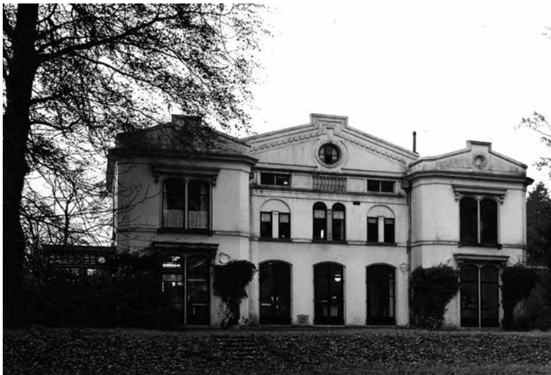
Flora de Vrijer