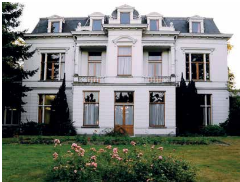
Villa Fatima (ca. 1990).

** Bijzonder, vooral omdat ze niet prettig lopen, veel te brede treden!! (auteur)