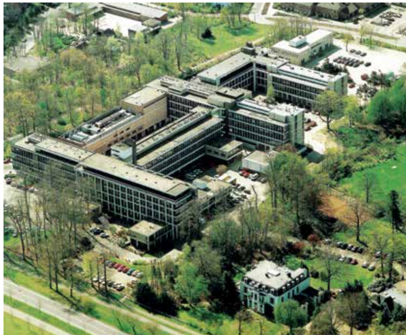
Luchtfoto Zeister TNO-complex (1988).

Bij het Koetshuis was een moestuin van een van de afdelingshoofden, waar hij iedere zaterdag te vinden was. Langs de tennisbaan, die intensief werd gebruikt, waren er later volkstuintjes voor medewerkers. De milieueisen waren in die jaren nog niet zo streng, of de TNO-medewerkers hielden zich er niet aan: vele