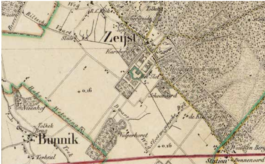
Figuur 1 Uitsnede uit de Kaart van de Provincie Utrecht uit 1850, blad IV.