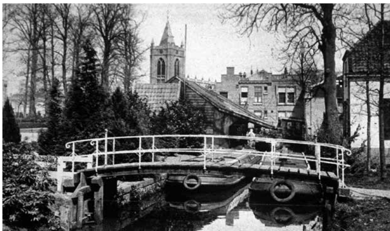
De oude haven van Zeist aan de Waterigeweg (1937). Bij het Schippershuis (afgebroken in 1961) lag de loswal van de firma Ekdom met het schuithuis.