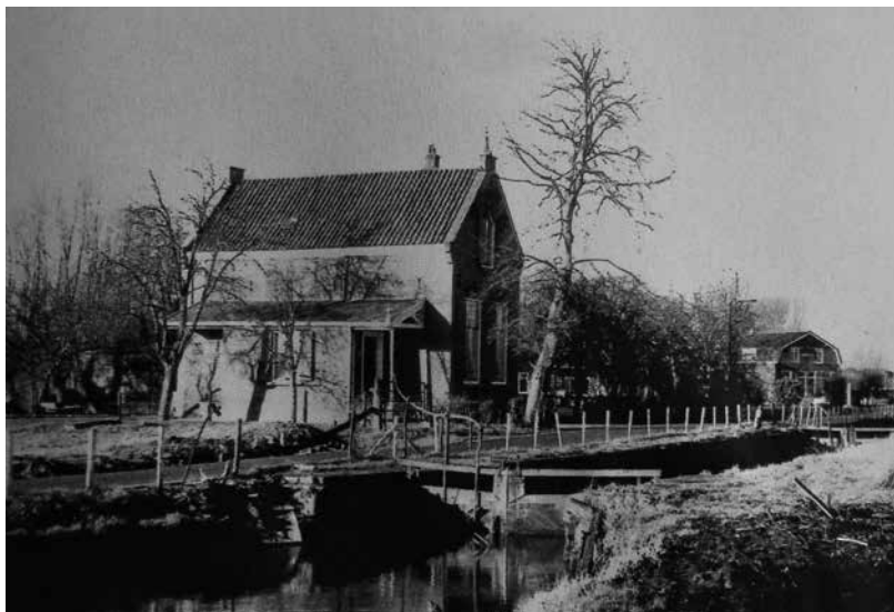
De Koppelsluis en sluiswachterswoning in buurtschap Het Klompje in Zeist-West (ca. 1960).

De inzet is om belangrijke elementen van de buurtschap zoals de sluis,