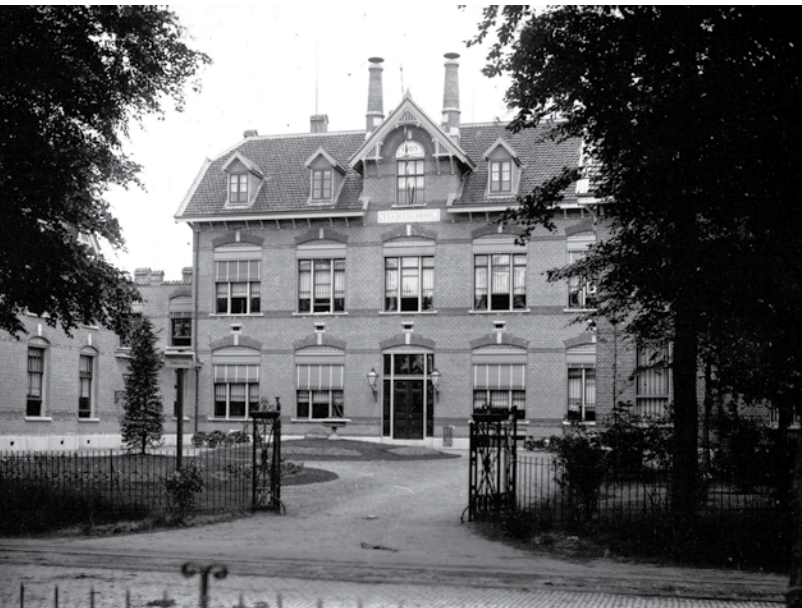
Eikenstein (ca. 1905).