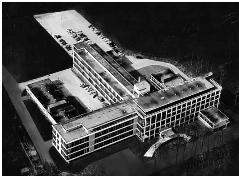
Luchtfoto CIVO TNO- gebouw (1965).

feestelijk geopend kon worden. Inmiddels was Villa Oirschot afgebroken. Het gebouw in Zeist is een imposant gebouw met haaks daarop 3 vleugels. Het nuttige vloeroppervlak bedraagt 14.000 m 2 , de inhoud 60.000 m 3 . Het geheel bestaat uit een betonskelet met vullingen van Afrosia (ook: Afrikaanse teak) houten ramen, waarvan de bewegende delen in staal zijn uitgevoerd. De vensters zijn praktisch alle dubbel beglaasd. De trappen zijn afgewerkt met kwartsiet. Voor de laboratoria werd de moduulmaat 1,50 m aangehouden. Het gebouw biedt royale werkruimte aan 250-300 personen. Er is een vergaderzaal voor 100 personen en een kantine voor 150 medewerkers. De gebogen entreetrappen zijn bijzonder**.