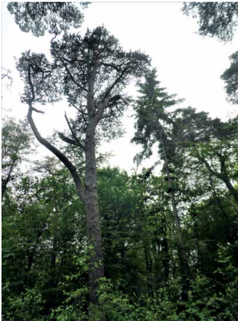
Een grove den in het Zeisterbos.