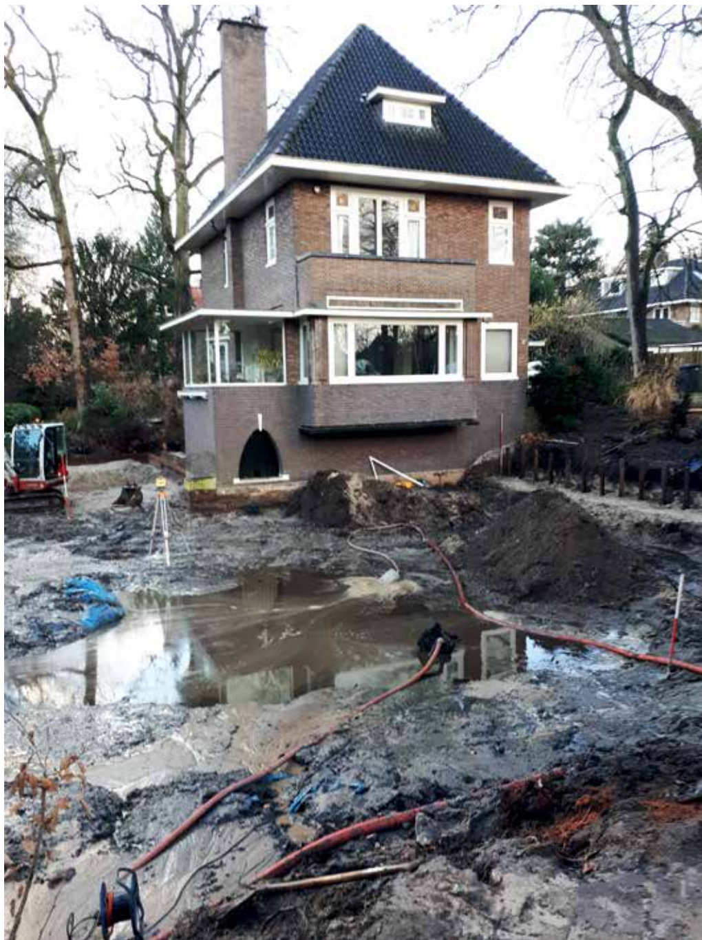
'Het huis in het water', Utrechtseweg 48a.