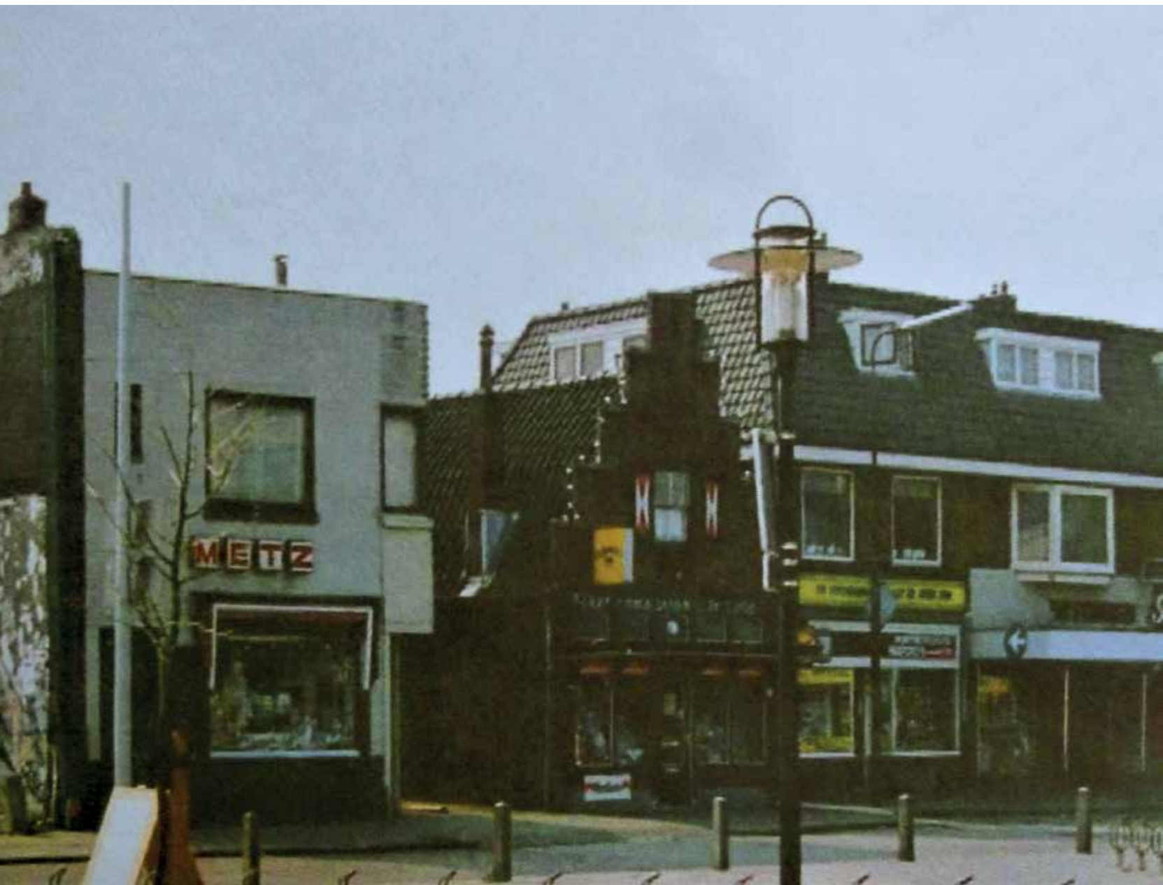
Metz in de Emmastraat (jaartal onbekend).