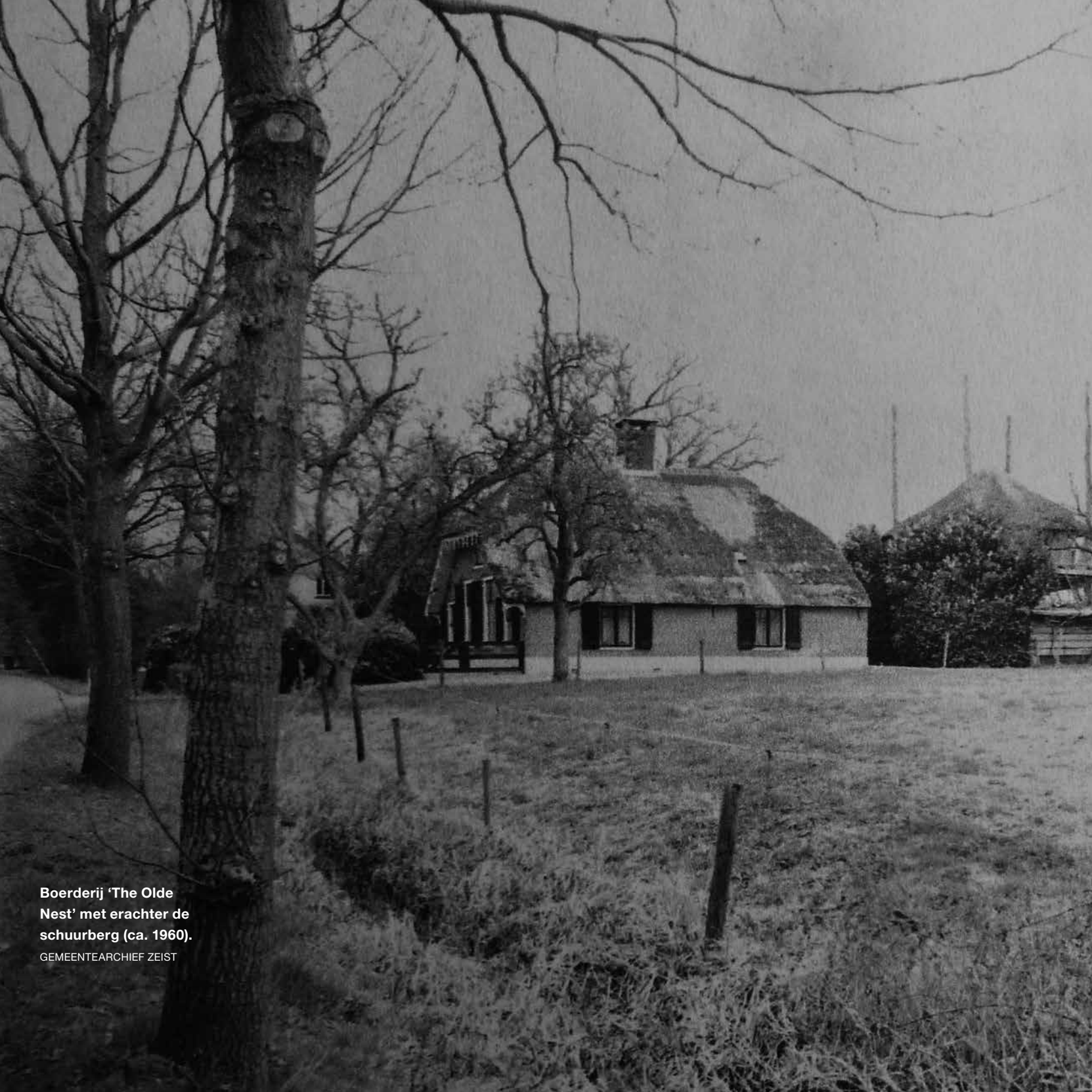
Boerderij 'The Olde Nest' met erachter de schuurberg (ca. 1960).