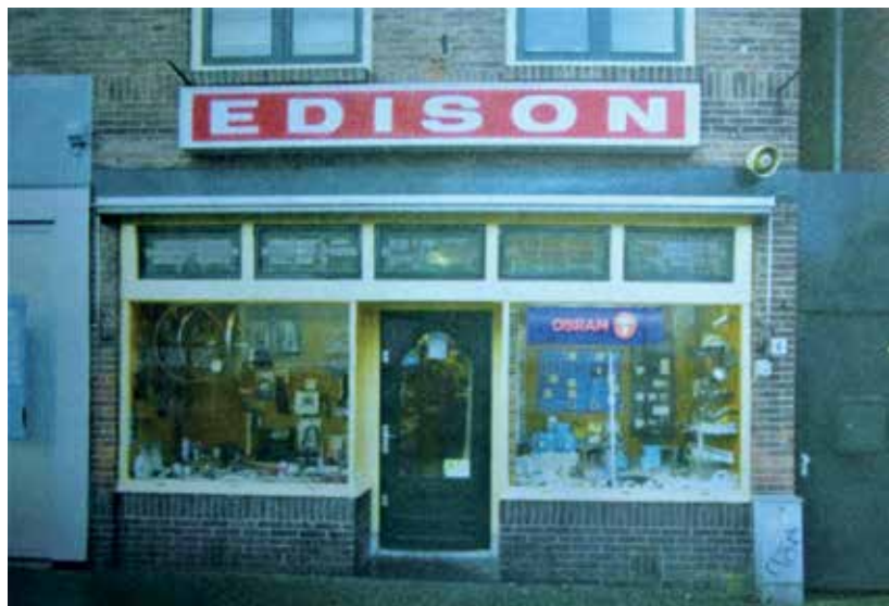
De winkel Edison (jaartal onbekend).