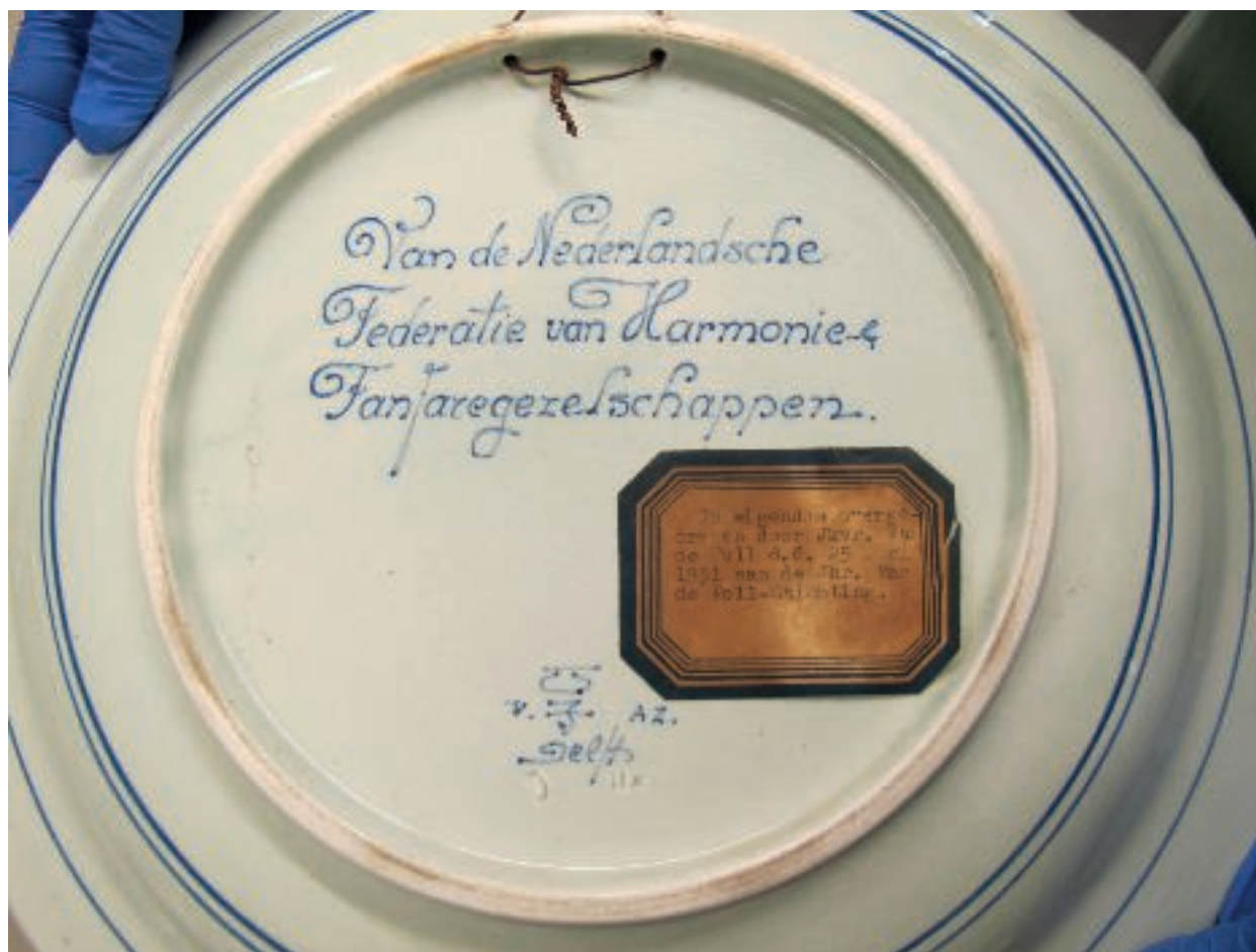
Detail achterzijde van een bord.

De officiële stichtingsdatum is 24 september 1951 en de definitieve naam: Van de Pollstichting (nu: ZHG). De borden moeten behoren tot de oudste collectieonderdelen van de Stichting, geschonken nog voor de officiële oprichting.