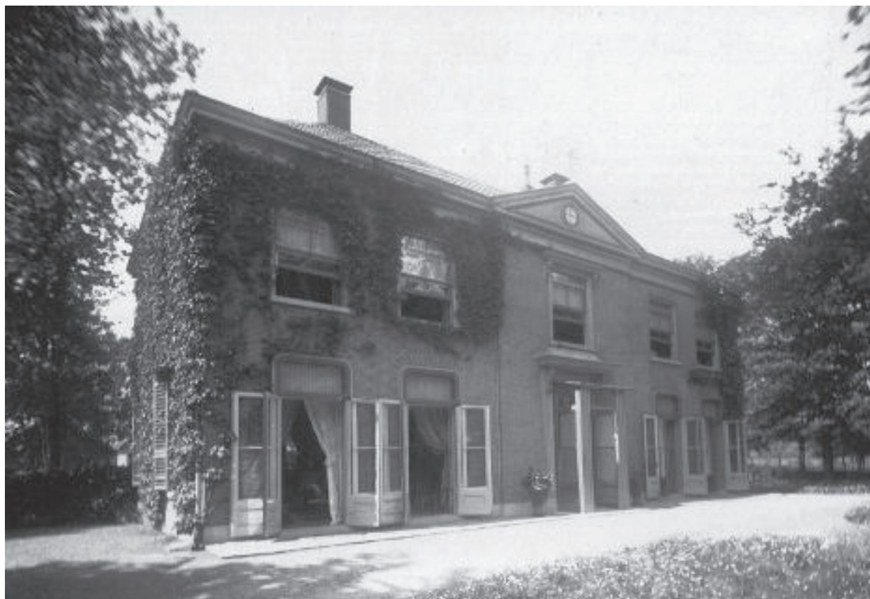
Huize Cattenbroeck (eerste helft 20 e eeuw).