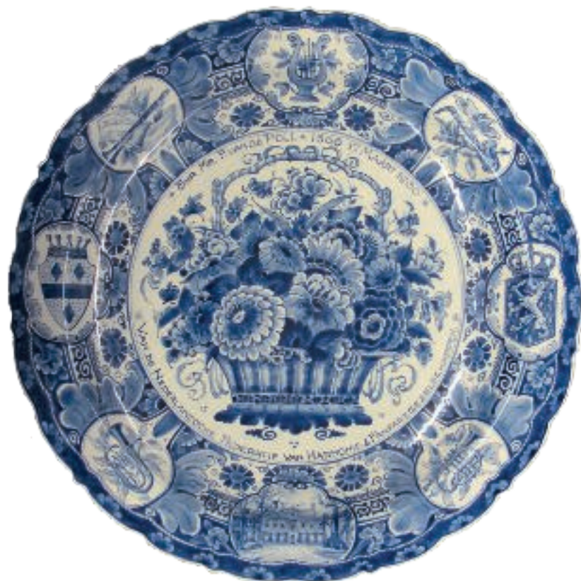
Het grootste herinneringsbord.