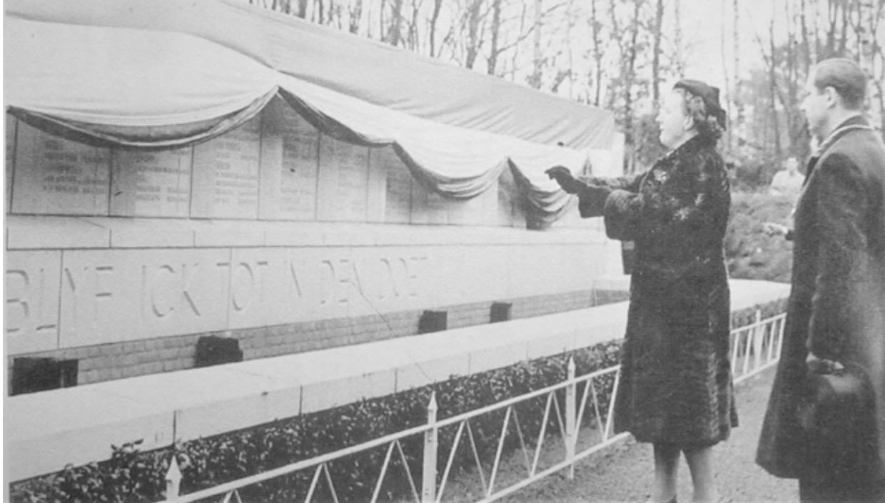
Koningin Juliana onthult het monument voor de geëxecuteerden op de fusilladeplaats van Kamp Vught (20 december 1947).