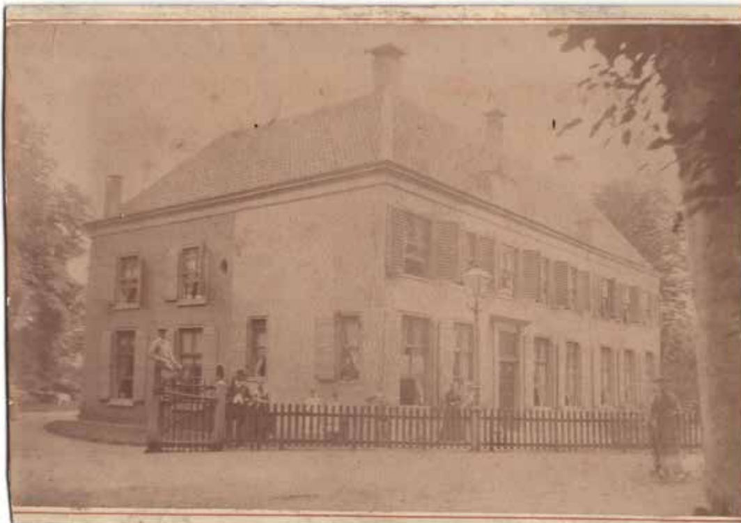
Het oude Veelzicht (1884).