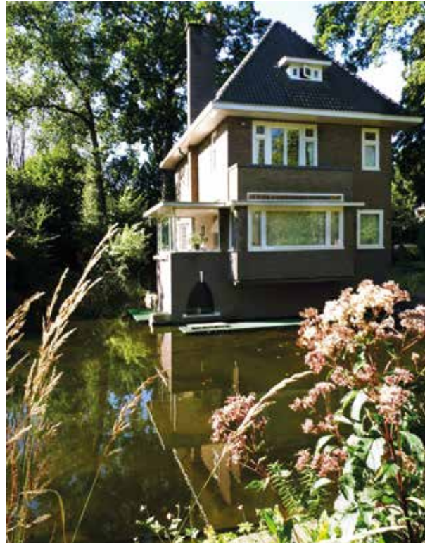
Poortje van Kersbergen aan de Utrechtseweg.