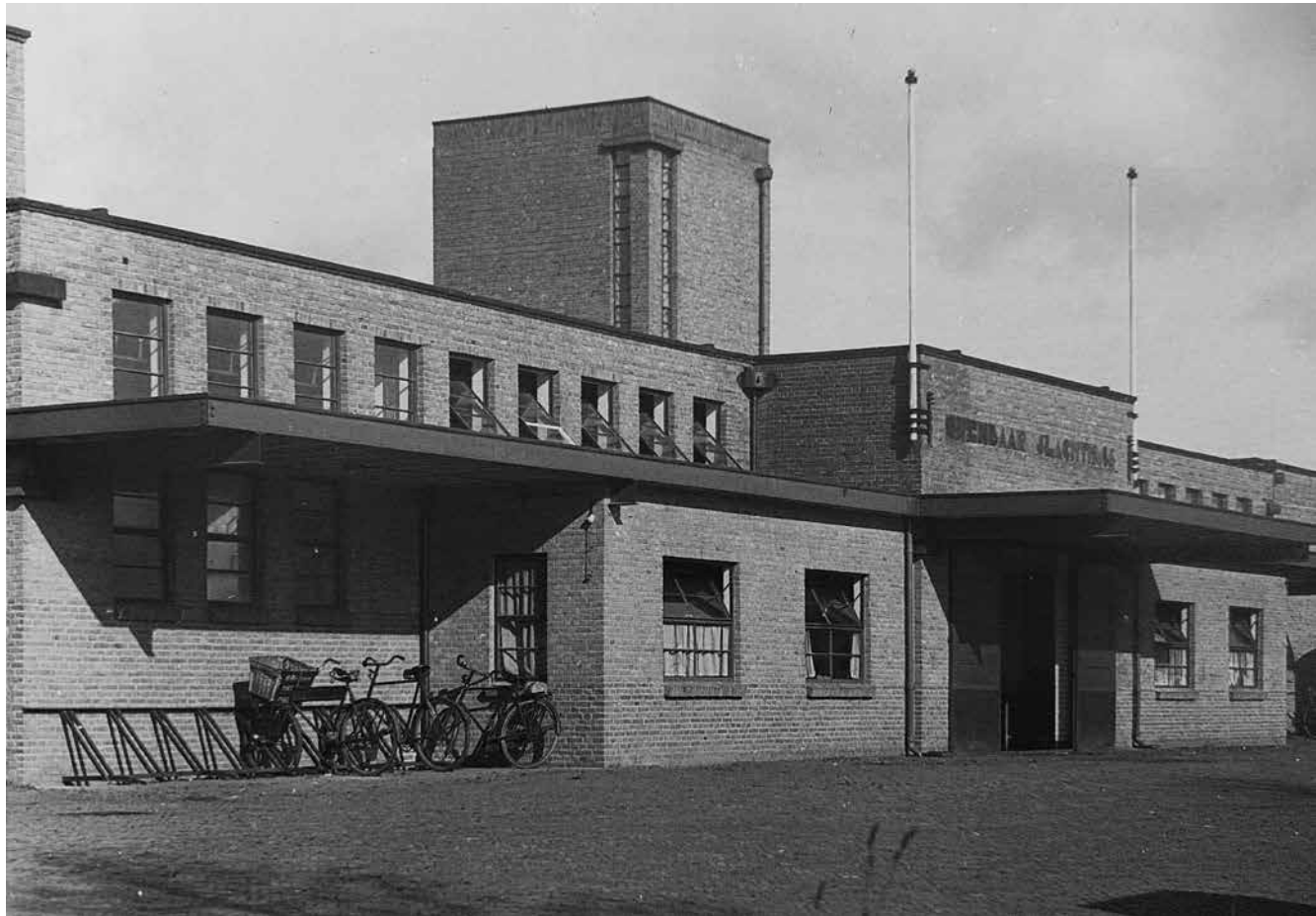
Vorgevel van het Slachthuis (1930)

medewerkers genoemd, dat is wel het geval in een artikel in de Nieuwe Zeister Courant van 21 mei 1954 ter gelegenheid van het 25-jarig bestaan van het slachthuis.