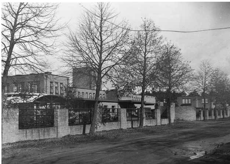
Voorzijde Openbaar Slachthuis (1930).

Voor de plaats van het slachthuis werd gekozen voor een bosrijke omgeving tussen een spoorbaan en een verkeersweg en de omliggende terreinen behoorden toe aan mooie buitenplaatsen! Er kwamen vele bezwaren tegen de plaats, men vreesde voor stankverspreiding, bodemverontreiniging en ontsiering van de omgeving. De gemeente raadpleegde diverse deskundigen daarover, maar die waren het niet eens met de bezwaren. De bouw ging daarom volgens plan van start en na twee jaar concludeert de directeur gemeentewerken dat de deskundigen gelijk hadden (geen overlast dus).