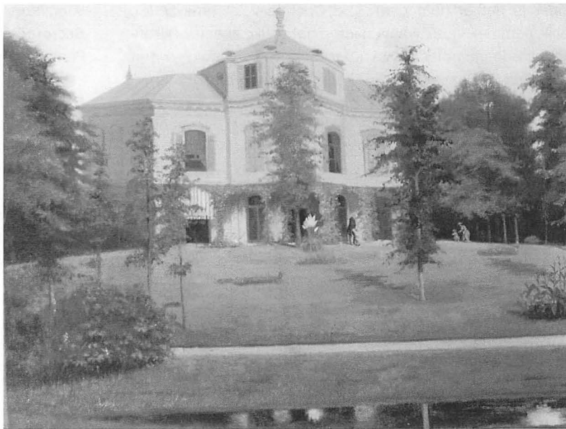
Landhuis Pavia, olieverf op doek, r.o. gesigneerd J.Schwartz en gedateerd 1869. Niet zichtbaar op de foto is de fraaie, vergulde schilderijlijst.