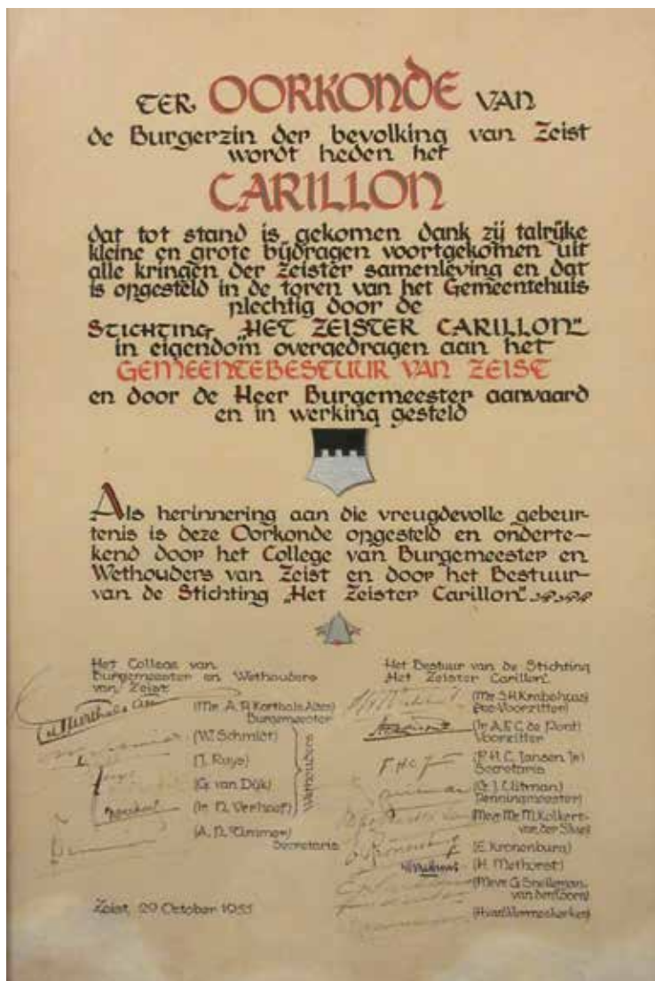
De oorkonde met de handtekeningen van het College van B&W en de bestuursleden van de Stichting 'Het Zeister Carillon'.