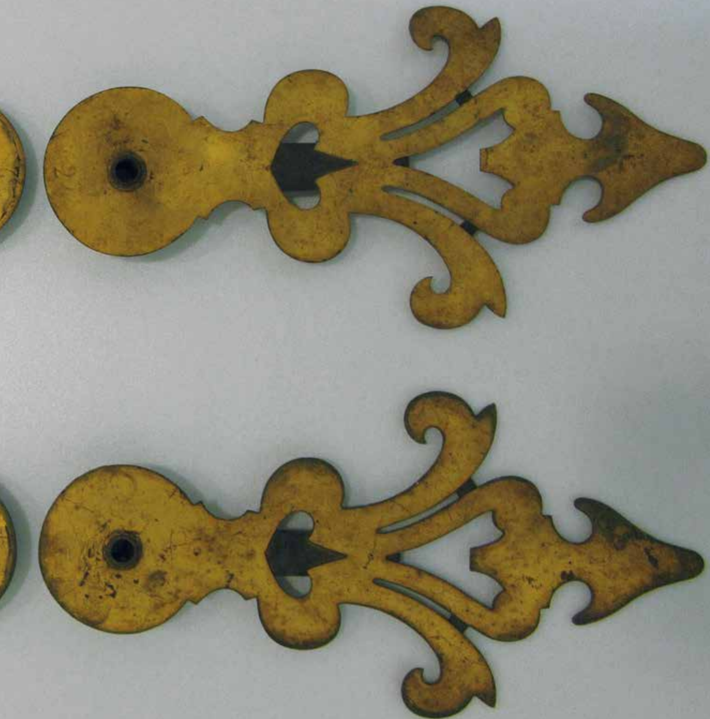
De wijzers van de dorpstoren in de collectie van het ZHG.