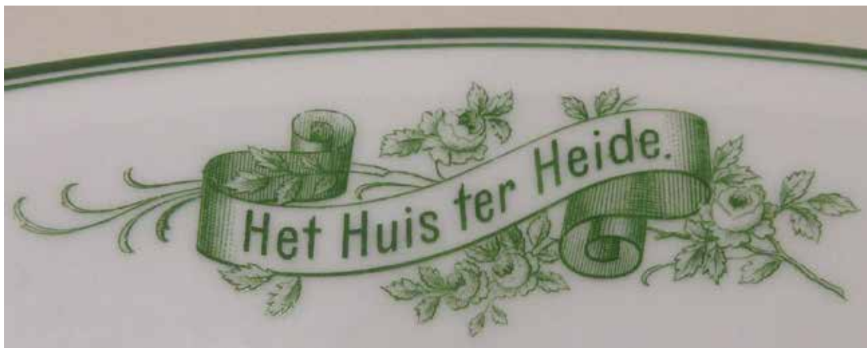
Het hotellogo op het servies.

Splinter er in 1654 stichtte. Zijn 'tapstede' stond in vak 20 van de in 1652 aangelegde weg tussen Utrecht en Amersfoort, de 'Wegh der Weegen'. Uit 1655 stamt de oudste vermelding: 'Op heden den XX Aug. 1655 aen 't Huys ter Heijden geconvoceert ende vergadert zijnde ...' 3 De buurtschap, die zich rond de herberg ontwikkelde, kreeg dezelfde naam. In de loop van de tijd is de herberg verbouwd en uitgebreid. Ook stonden er verschillende bijgebouwen,